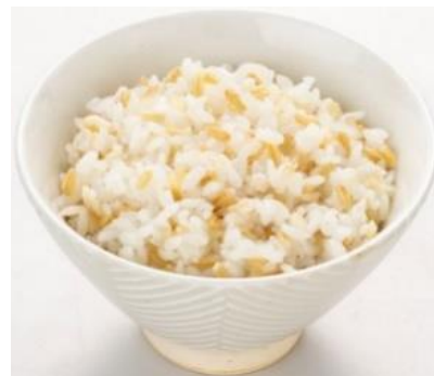
炊き上がりイメージ