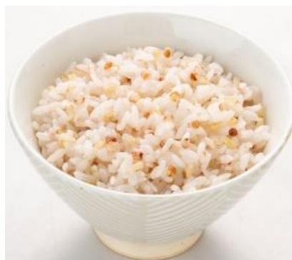
炊き上がりイメージ