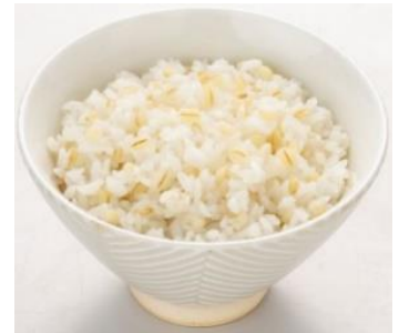
炊き上がりイメージ