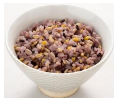
炊き上がりイメージ