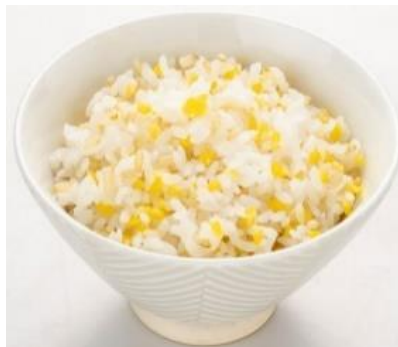
炊き上がりイメージ